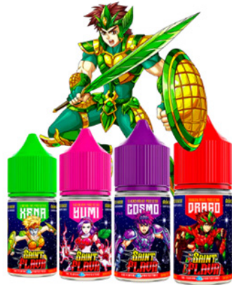
SAINT FLAVA BY SWOKE

On retrouve aussi l'imagerie des jeux vidéo :